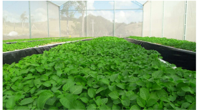
Figura 4. Disposição das bancadas com alto adensamento de plantas.

de vegetação recoberta por tela antiafídica nas laterais e com filme agrícola no teto; possui também abertura superior para melhor circulação de ar quente e proteção da abertura com tela antiafídica, com estrutura de bancadas elevadas de produção divididas em 8 bancadas de 18 m X 1,5 m, com corredores de 0,80 m entre bancadas, trabalhando com adensamento de plantas de 90 plantas por m 2 , como visto nas Figuras 4 e 5.