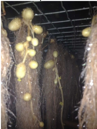
Figura 6 Exemplo de alta produtividade por área, resultado da tecnologia de produção empregada e alto adensamento.

O alto adensamento de plantas e o ambiente não perfeitamente isolado tornam o ambiente suscetível a contaminações por patógenos, como os causadores da requeima, e são ambientes propícios para alta disseminação e multiplicação, caso manejo não seja feito de maneira correta, interferindo drasticamente na produtividade.