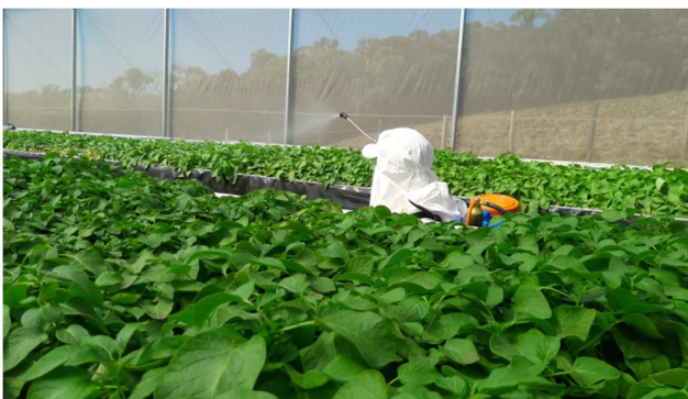
Figura 7. Exemplo de manejo de aplicação de fungicida convencional.

O manejo atualmente é realizado manualmente com bomba costal de 20 L de forma empírica, seguindo recomendações de fabricantes e orientações do agrônomo responsável técnico de forma preventiva, com alto custo de produção envolvido, sendo ótima oportunidade para automatização de processo de manejo.