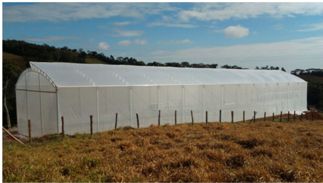
Figura 5. Casa de vegetação como ambiente controlado.

O alto adensamento de plantas e o ambiente não perfeitamente isolado tornam o ambiente suscetível a contaminações por patógenos, como os causadores da requeima, e são ambientes propícios para alta disseminação e multiplicação, caso manejo não seja feito de maneira correta, interferindo drasticamente na produtividade.